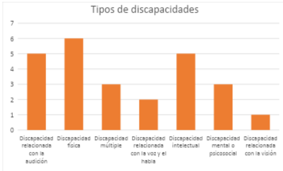
Figura 1: Encuestadas por tipos de discapacidad: menstruantes con discapacidad (n=25)

Se llevó a cabo una encuesta rápida en línea a pequeña escala con 25 MWD. De ellas, el 24 % tenía una discapacidad física, el 20 % tenía una discapacidad intelectual y auditiva, el 12 % tenía una discapacidad múltiple y mental, el 8 % tenía una discapacidad relacionada con la voz y el 4 % restante tenía una discapacidad relacionada con la visión. La siguiente figura presenta los tipos de discapacidad de las personas encuestadas que entraban en la categoría de MWD.